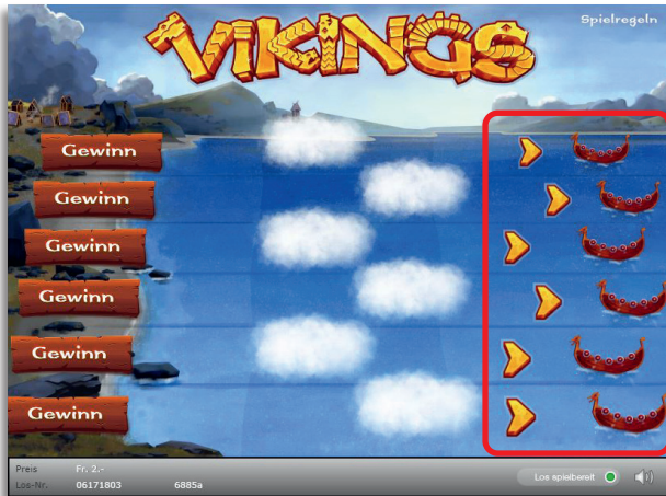
Beispiel: Gewinn Fr. 14.-