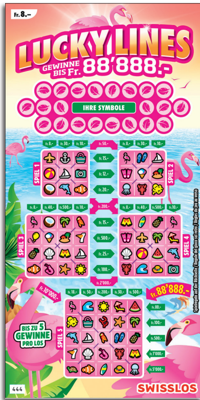
Beispiel: Gewinn Fr. 28.- = (Fr. 8.- + Fr. 20.-)