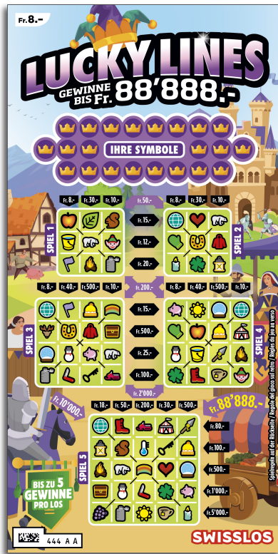
Esempio: La vincita è di Fr. 28.- = (Fr. 8.- + Fr. 20.-)